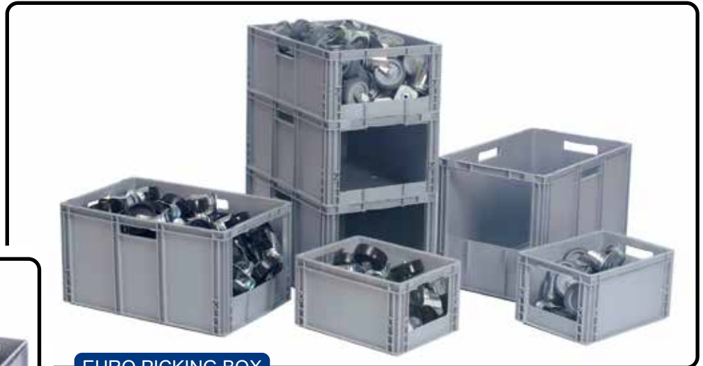
EURO PICKING BOX