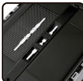
Precintables con bandas de plástico