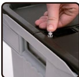
Aplicación taco de plástico