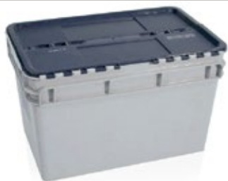
Homologada UN con tapa azul