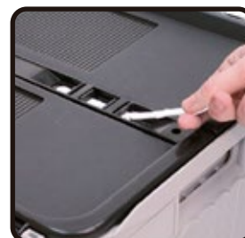
Aplicación bandas de plástico