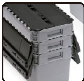
Apilables y encajables