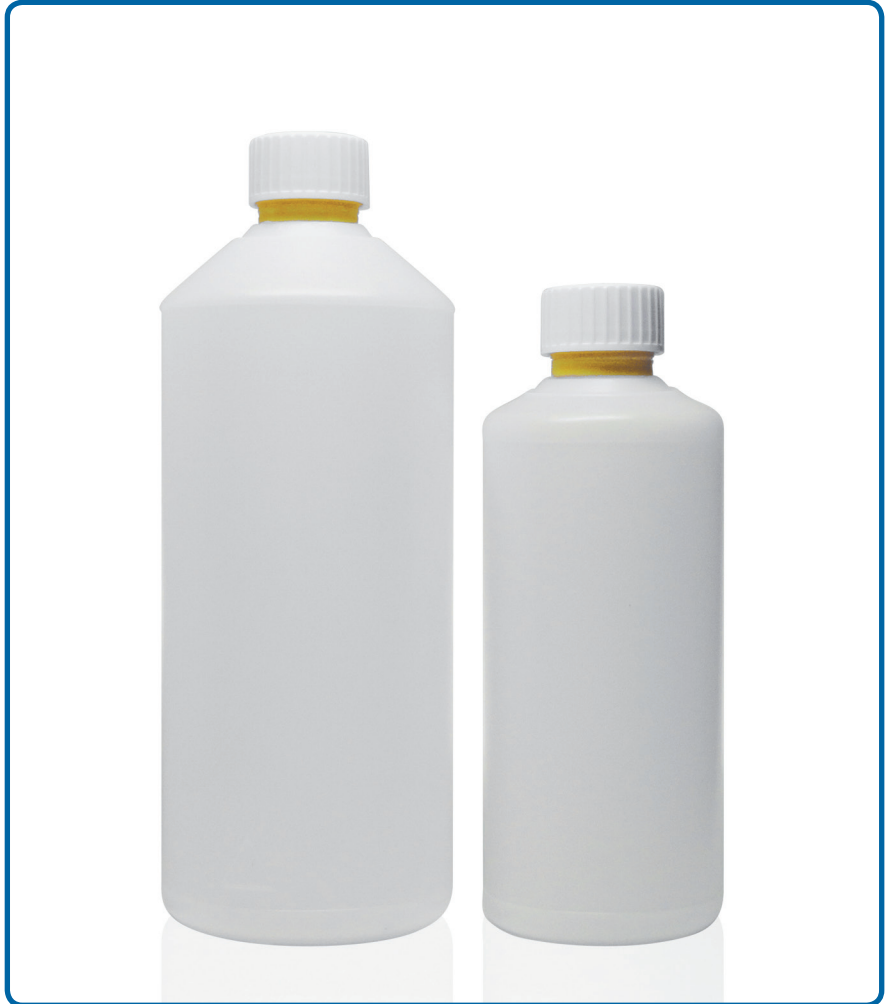
BOTELLAS BENI SIN GRADUACIÓN