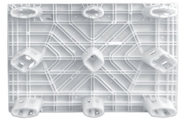
Detalle superficie inferior